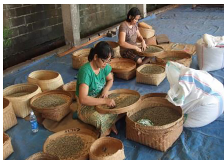
▲ハンドピックによる選別